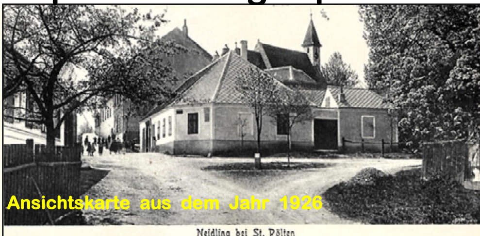
Ansichtskarte aus dem Jahr 1926